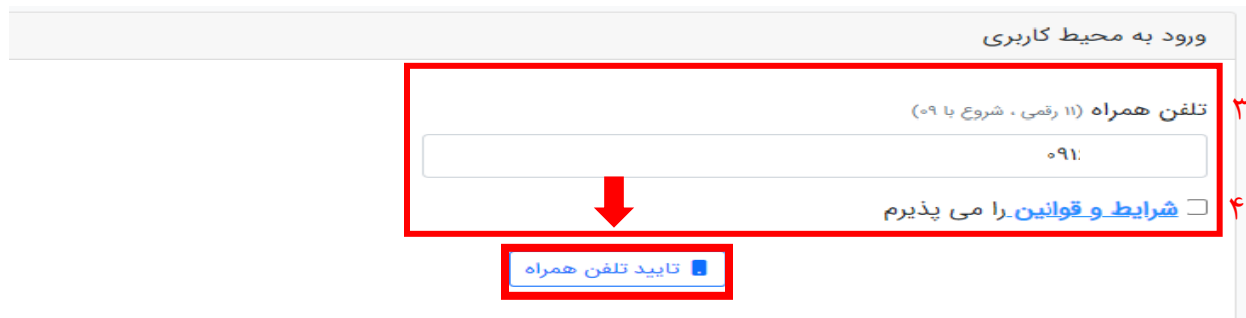
تصویر ۲. وارد کردن تلفن همراه