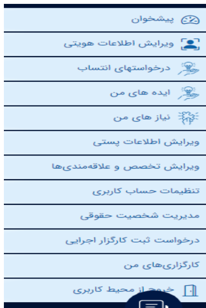
تصویر ۳۸. انتخاب ویرایش اطلاعات پستی