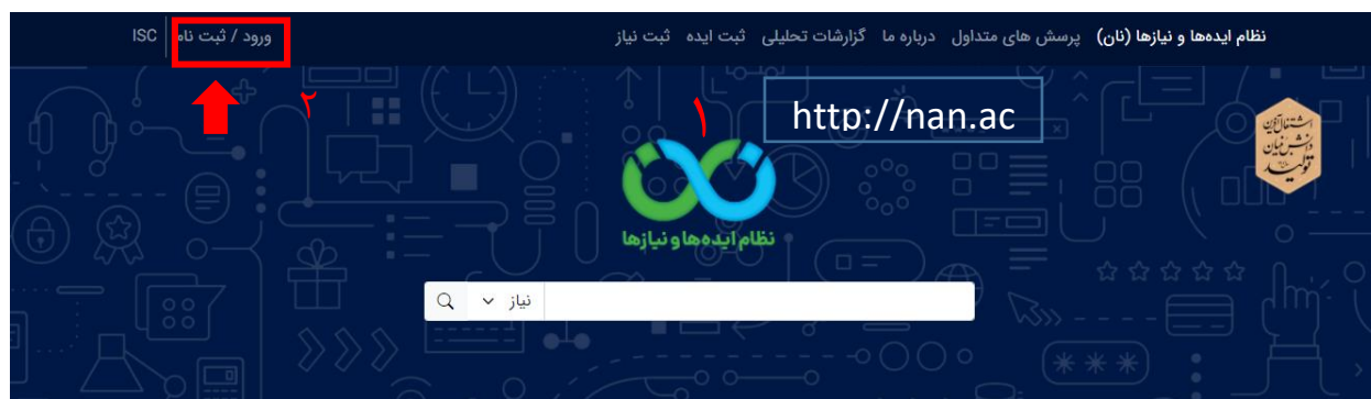
تصویر ۱. ثبت نام