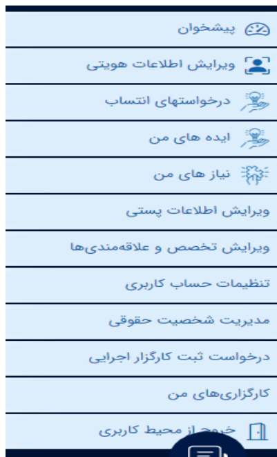
تصویر ۴۱. انتخاب ویرایش تخصص و علاقه مندی ها