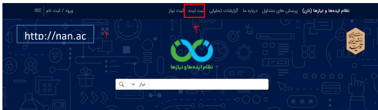
تصویر ۸. ثبت ایده

نکته: ایده‌های ثبت شده بصورت موقت در پنل کاربری، بخش ایده‌های من در دسترس خواهد بود.