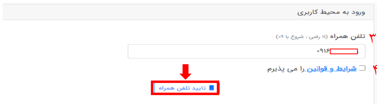
تصویر ۵. وارد کردن تلفن همراه