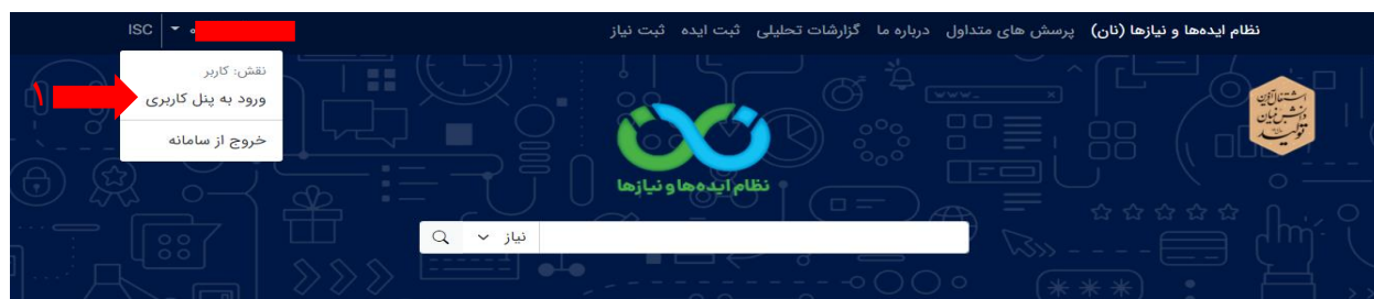
تصویر ۴۰. ورود به پنل کاربری

نکته: تخصص و علاقه مندی های کاربر در اطلاع رسانی های مربوط ایده و نیاز مورد توجه قرار می گیرد.