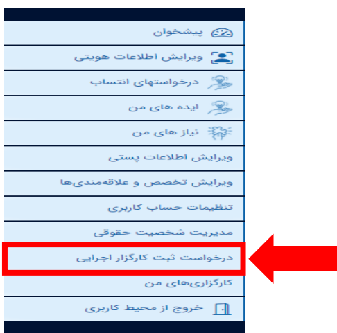
تصویر ۳۲. انتخاب درخواست ثبت کارگزار اجرایی