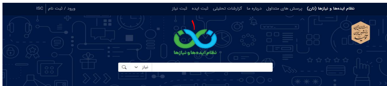
تصویر ۳۰. ورود به سامانه