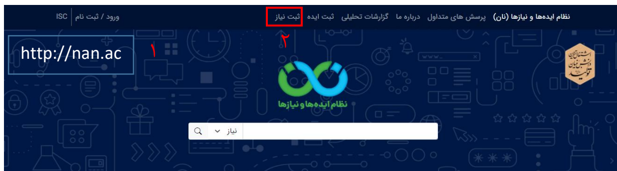
تصویر ۱۸. انتخاب ثبت نیاز

نکته: نیازهای ثبت شده بصورت موقت در پنل کاربری بخش نیازهای من در دسترس خواهد بود.