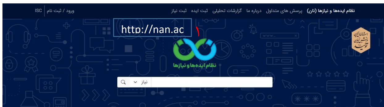
تصویر ۲۶. ورود به سامانه