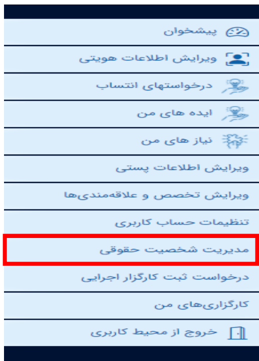
تصویر ۲۸. انتخاب مدیریت شخصیت حقوقی

وزارت علوم، تحقیقات و فناوری معاونت فناوری و نوآوری