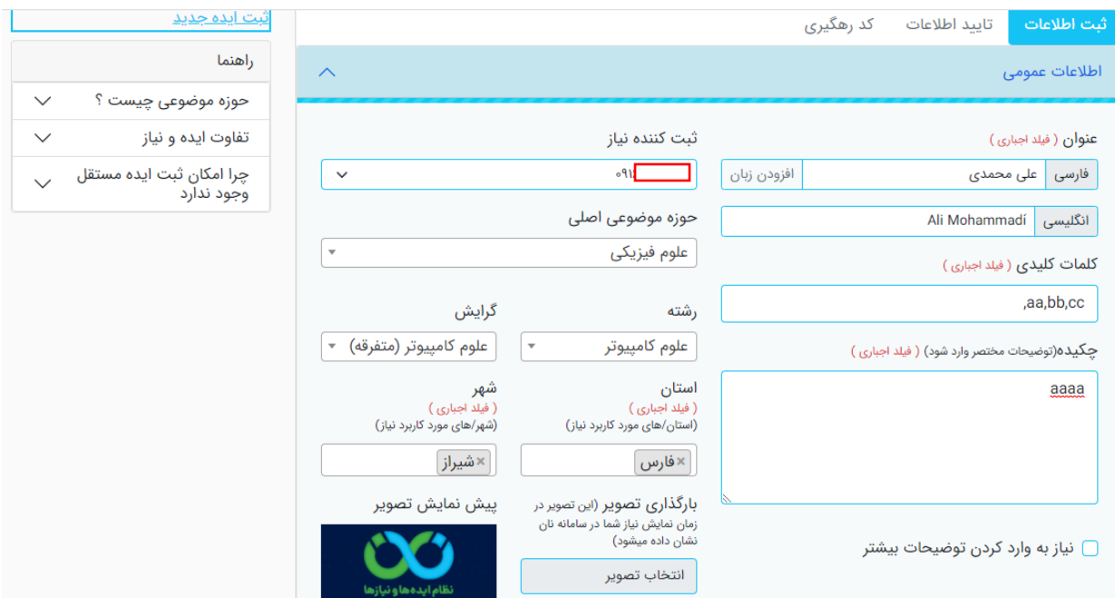
تصویر ۲۲. اطلاعات عمومی نیاز

فرم اطلاعات عمومی نیاز همانند تصویر ۲۲ می‌باشد که موارد مهم آن در ادامه شرح داده خواهند شد. وارد کردن بیشتر اطلاعات موجود در بخش اطلاعات عمومی در زمان ثبت اجباری می‌باشد.