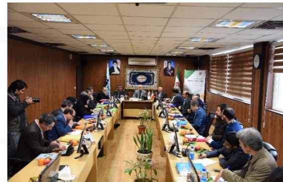
مهارتی قبل از خدمت سربازی دارند.

سردار فرحی در خاتمه سخنان خود پیوستگی ارکان اصلی این طرح ۱- دانشگاه فنی و حرفه‌ای و دانشگاه جامع علمی کاربردی ۲- شاخه فنی و حرفه‌ای وزارت آموزش و پرورش ۳- سازمان فنی و حرفه‌ای را در اثربخشی این طرح و در راستای تربیت جوانان کارآفرین و خلاق در مسیر اشتغال‌زایی و در نهایت توسعه را ضروری دانست.